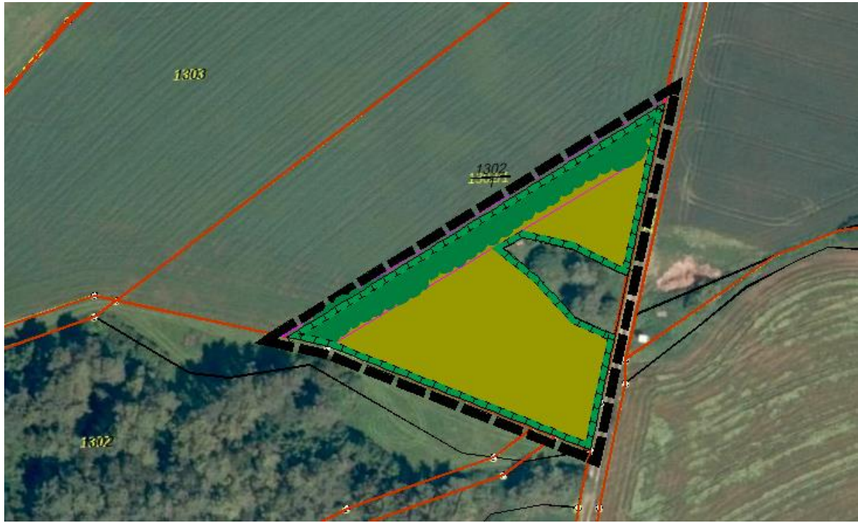
Abbildung: Festgesetzte Maßnahmen auf der Ausgleichsfläche (ohne Maßstab).